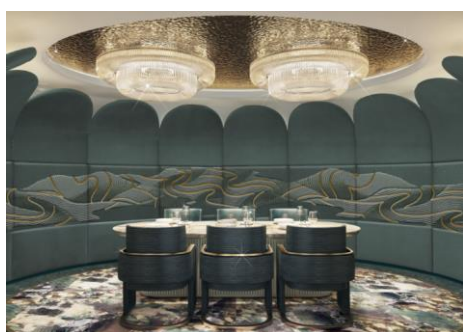
Restaurant Le Voyage

De nombreuses surprises attendent les passagers du futur navire de la compagnie qui sera inauguré au mois de novembre. La compagnie a revisité son offre de bar et de restauration en créant de nouveaux décors pour les restaurants et en enrichissant les menus de nouveaux plats et cocktails